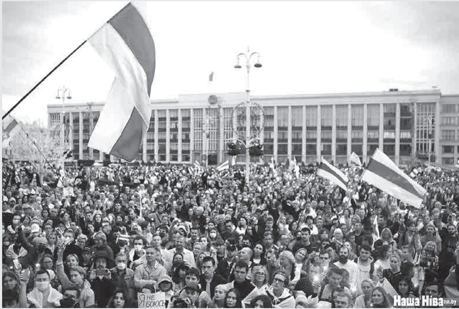
25 жніўня тысячы людзей у Мінску пад залевай святкавалі гадавіну аднаўлення Незалежнасці.

к органам государственной власти, политическим партиям, общественным объединениям, гражданам Российской Федерации